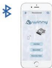
Smart phone kontrola putem Bluetooth-a