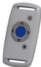
Opcionalni daljinski upravljač