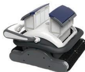
Pristup filter korpama sa upravljač