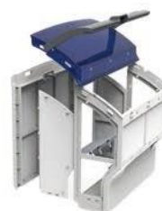
2 velike filter korpe